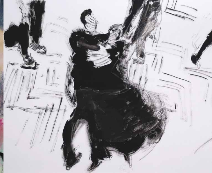
Sabine Rittweger (*1953) ist in Erfurt geboren und lebt in Eisenach. 1973 bis 1975 Studium an der Hochschule für Grafik und Buchkunst Leipzig. 1990 Gründungsmitglied „Die Thüringer Sezession“. Nach einem Arbeitsstipendium Thüringens erhielt sie den Kunstpreis arthuer 2014. Freischaffend ist sie seit 1979 tätig. Ihre Arbeitsgebiete: Malerei, Druckgrafik, Zeichnung, Fotografie, die in Ausstellungen und Beteiligungen im In- und Ausland gezeigt werden. Die Arbeiten finden sich in privaten, öffentlichen und Institutionellen Sammlungen.